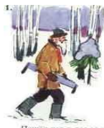
Поплел дед в лес за дровами.