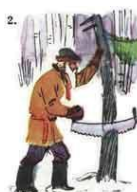
Пил дерево, пи- ла и уснул.