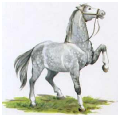
Конь бьет копытами