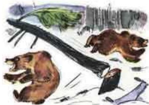
Расскажите, что было дальше.