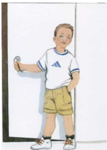
Мальчик хлопает дверью