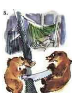
Один кричит: «Мой шпатель»