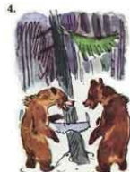
Прибегает медве- жата.