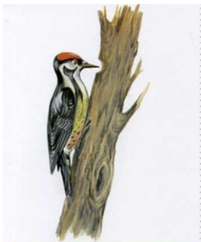
Дятел стучит по стволу дерева