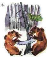
Другой кричит: «Нет, мой!»

Ребенку требуется установить последовательность событий по серии картинок. Покажите ребёнку серию картинок