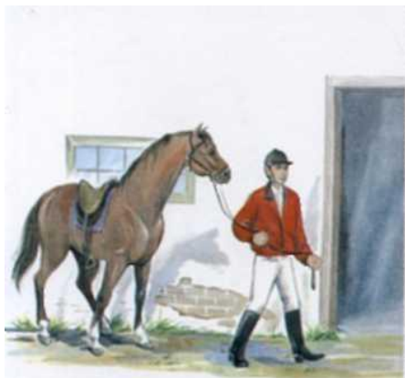
Всадник заводит коня в конюшню